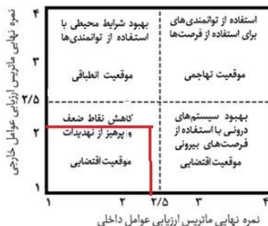
شکل ۳- ماتریس داخلی- خارجی ناشی از مدل سوات در شهر آباد

امتیازات جداول ۸ و ۹ نشانگر آن است که امتیازات نقاط قوت (۱/۸۱) بیشتر از ضعف (۰/۶۵) و همچنین فرصت‌ها (۱/۰۶) بیشتر از تهدیدات (۰/۹۸) است ولی این ارجحیت چندان برای این شهر موقعیت مناسبی را ایجاد نمی‌کند. با انتقال امتیازات نهایی کسب‌شده از عوامل داخلی و خارجی، با توجه به شکل ۴، مشاهده می‌گردد که امتیازات در ربع سوم محور مختصات واقع شده که نشان‌دهنده موقعیت اقتضایی است. این موقعیت در نتیجه اینکه هم عوامل داخلی و هم خارجی از امتیاز ۲,۵ کمتر بوده‌اند، روی نمودار ایجاد شده است که بیانگر استراتژی‌های WT یا تدافعی می‌باشد. هدف در اجرای استراتژی‌های WT کم کردن نقاط ضعف داخلی و پرهیز از تهدیدات ناشی از محیط خارجی است. در چنین موقعیتی وضعیت تقریباً نامناسب بوده و باید سعی نمود که با اقداماتی از چنین وضعیتی پرهیز نمود.